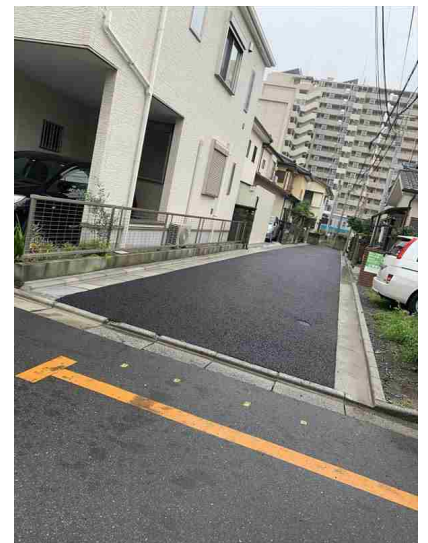
私道助成事業により、道路冠水の心配がなくなりました（針ヶ谷）