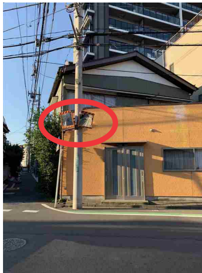
見通しの悪かった交差点にカーブミラーを設置（常盤）